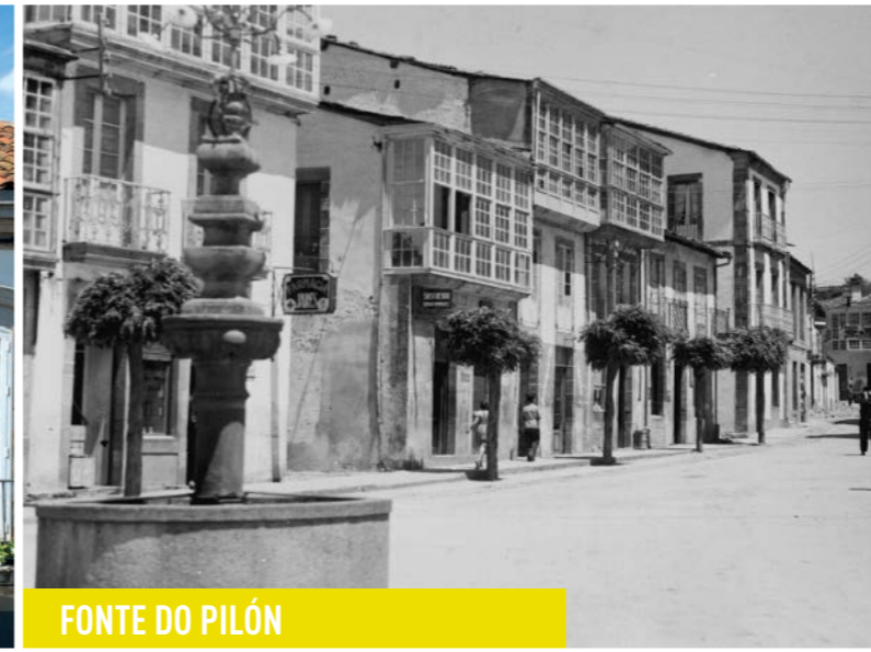
FORTE DO PILÓN