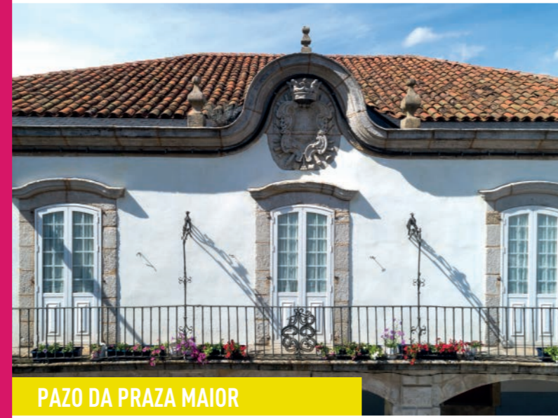
PAZO DA PRAZA MAIOR