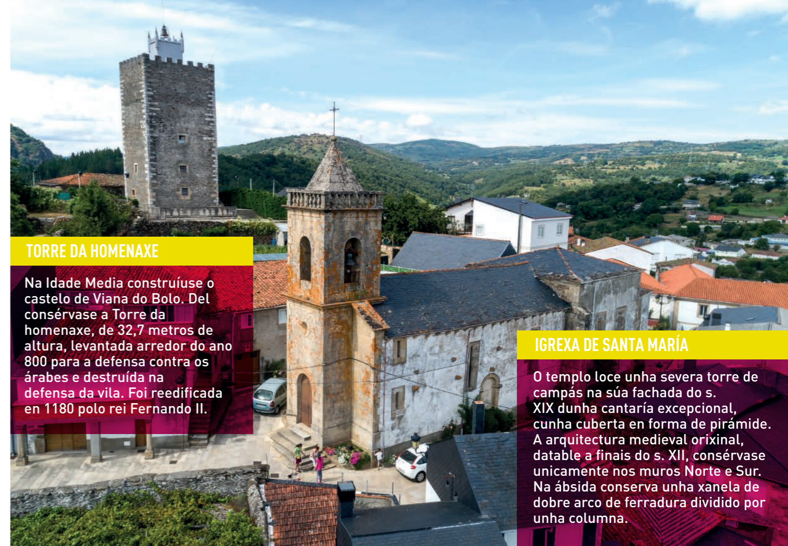
TORRE DA HOMENAXE

Na Idade Media construíuse o castelo de Viana do Bolo. Del consérvase a Torre da homenaxe, de 32,7 metros de altura, levantada arredor do ano 800 para a defensa contra os árabes e destruída na defensa da vila. Foi reedificada en 1180 polo rei Fernando II.