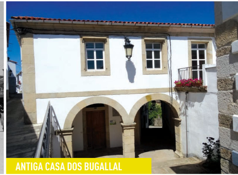
ANTIGA CASA DOS BUGALLAL