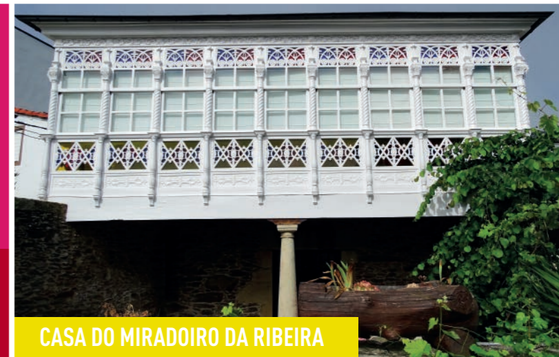
CASA DO MIRADOIRO DA RIBEIRA